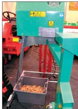
▲ Kíméletes munkát végez a diótörő berendezés

Sorolja gyomirtására szolgál a Fisher szárzúzója