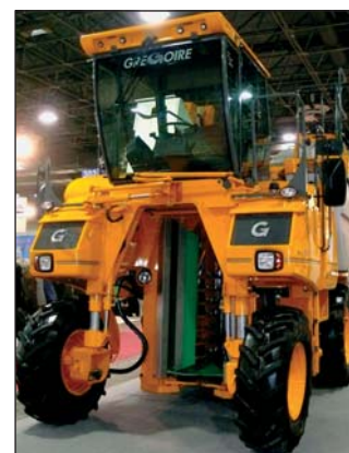
▲ A Szőlészet Pincészet kiállítás legnagyobb gépe a Gregoire szőlőkombájn volt az Innova Agro Kft. standján