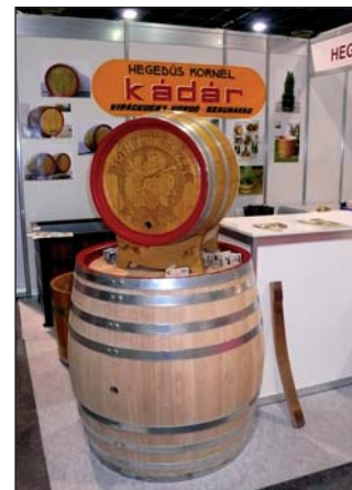
▲ Míves bordókat készít Hegedüs Kornél