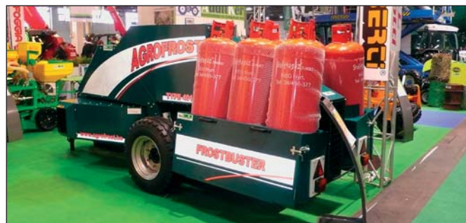
▲ Újabb változatán mindkét oldalon alulról fújja ki a forró levegőt a fagyvédő berendezés