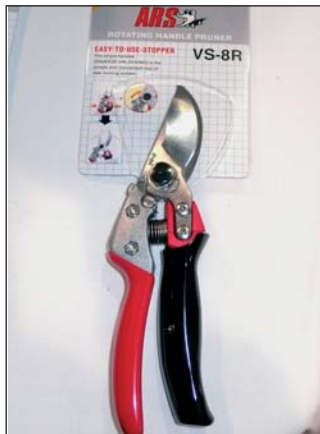
▲ Kényelmes munkát ígér az új forgó nyelű japán metszőolló

Igencsak eltörpült az Agro+Masheexpo mellett a kifejezetten a borágazatnak szánt Szőlészet és Pincészet kiállítás. Az ugyancsak kertészeti szakkiállítással, a Magyar Kerttel egy pavilonban szervezett bemutatón volt ugyan minden, de csak egy, esetleg két „példányban”. A kertészeknek is érdemes volt átnézni a Agro+Masheexpo kínálatát, hiszen több cég forgalmaz speciális kertészeti munkagépeket.