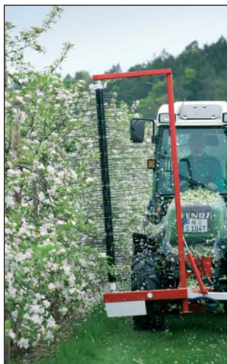
◀ Virágzásban ritkítja a gyümölcsöt a Fruit Tec berendezés